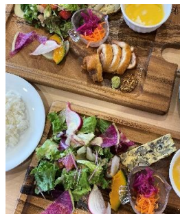
メイン料理は地元伊達鶏のロースト ※鶏料理が苦手な方はご相談ください